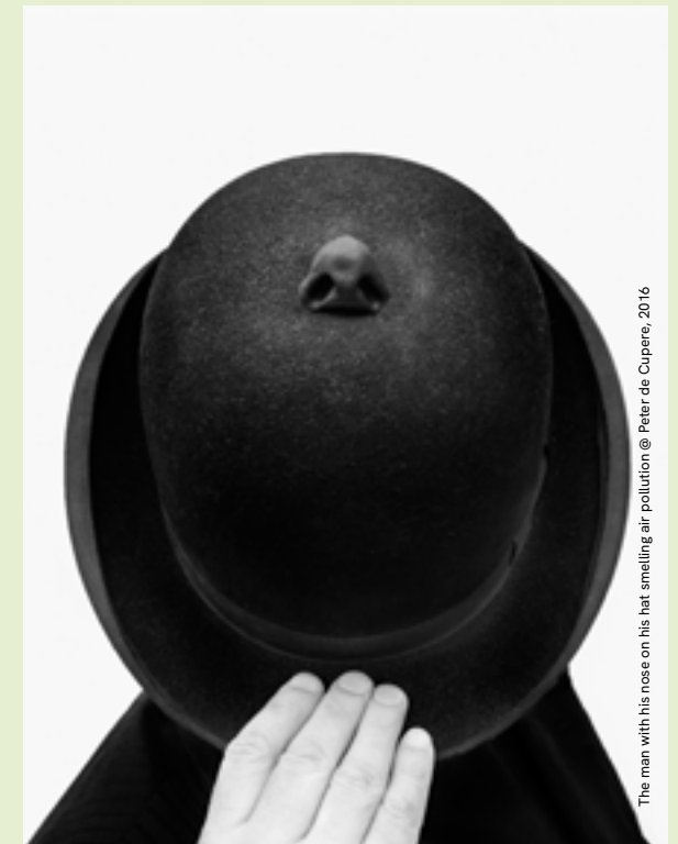
The man with his nose on his hat smelling air pollution @ Peter de Cupere, 2016

€ 1/leerling voor scholen in Knokke-Heist € 2/leerling voor scholen buiten de gemeente